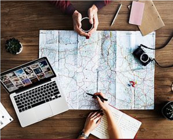
Anreise & Stadtplan