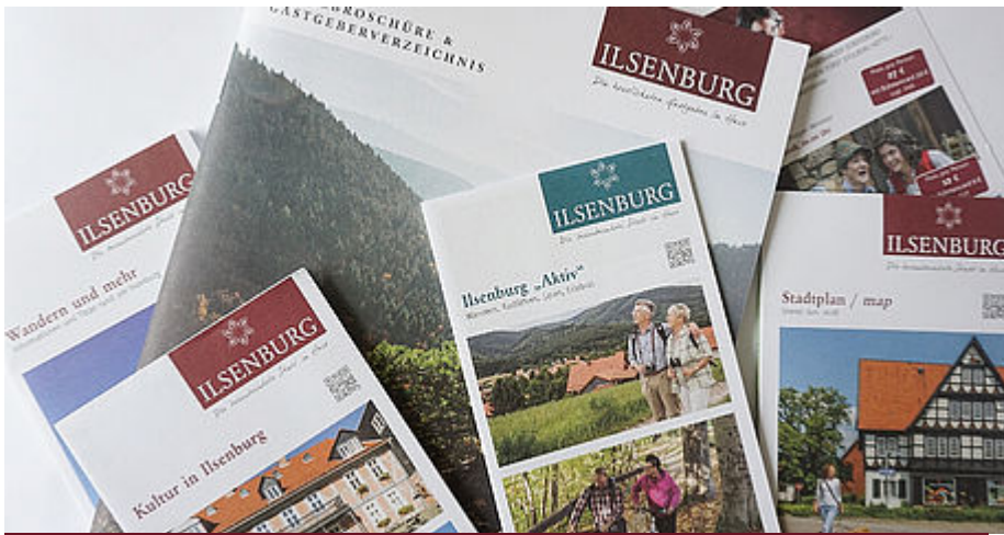
Broschüren & Flyer