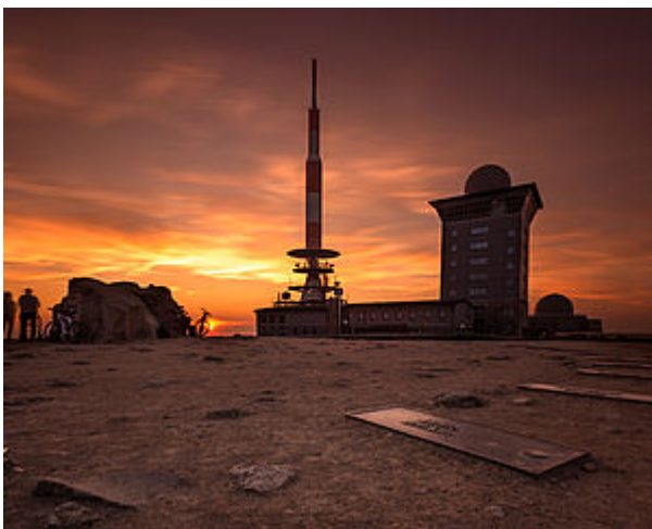
BROCKENCAM - LIVE