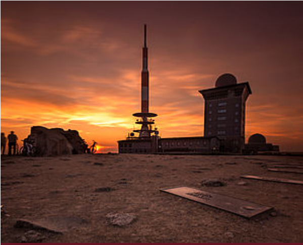
BROCKENCAM - LIVE