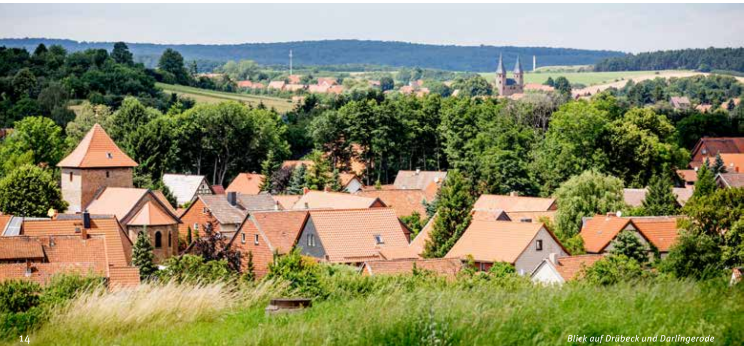
Blick auf Drübeck und Darlingerode

Heimatmuseum Komturhof Darlingerode Im Winkel 3, 38871 Ilsenburg www.komturhof-darlingerode.de